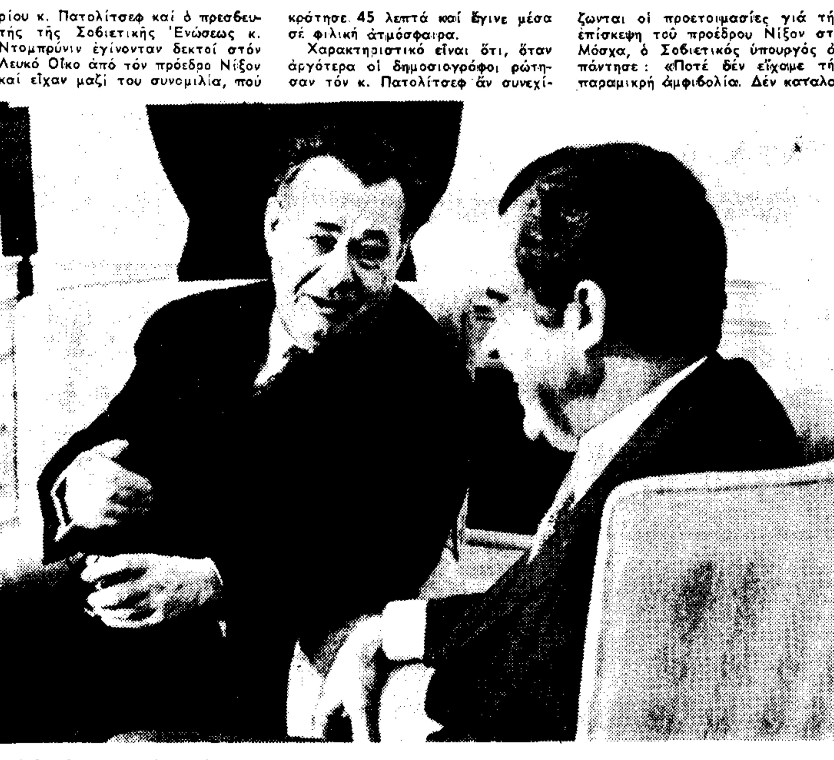
Φιλική συνομιλία χθες στο Λευκό Οίκο μεταξύ του προέδρου Νίξον και του Ρώσου υπουργού Έξωτερικου Έμποριου Νικολάι Πατολίτσκι