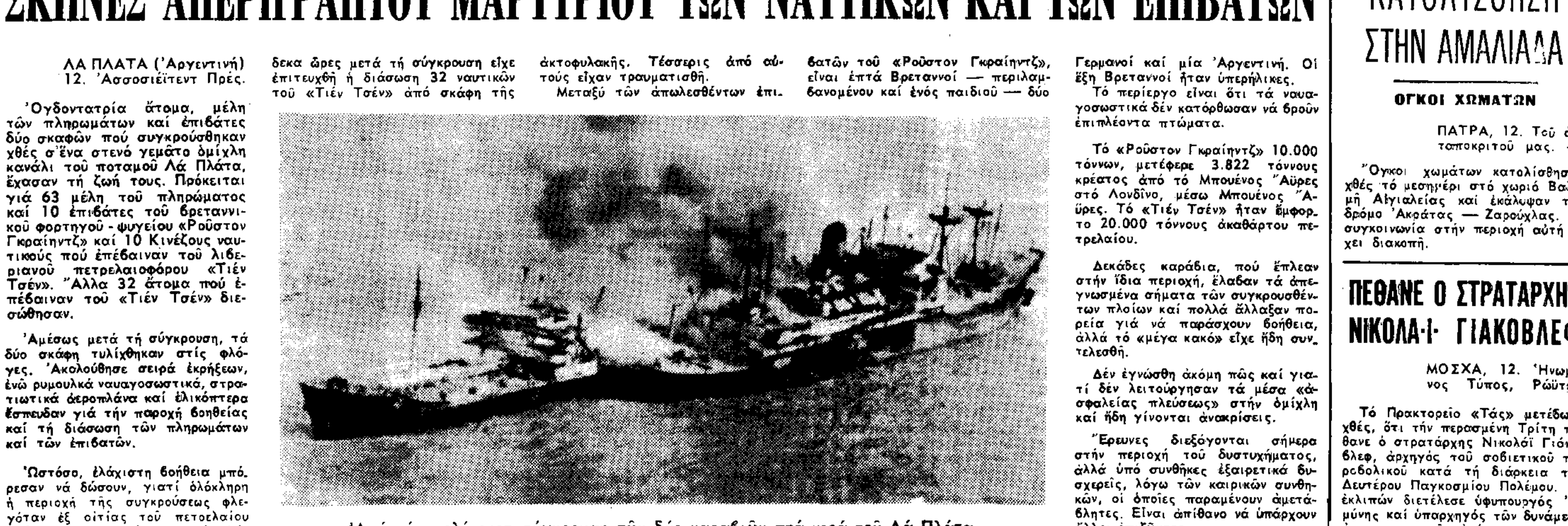
Από την πολυκρουση σύγκρουση τών δύο καραβιών στή νερά τού Λά Πλάτα.

ΣΚΗΝΕΣ ΑΠΕΡΙΓΡΑΠΤΟΥ ΜΑΡΤΥΡΙΟΥ ΤΩΝ ΝΑΥΤΙΚΩΝ ΚΑΙ ΤΩΝ ΕΠΙΒΑΤΩΝ