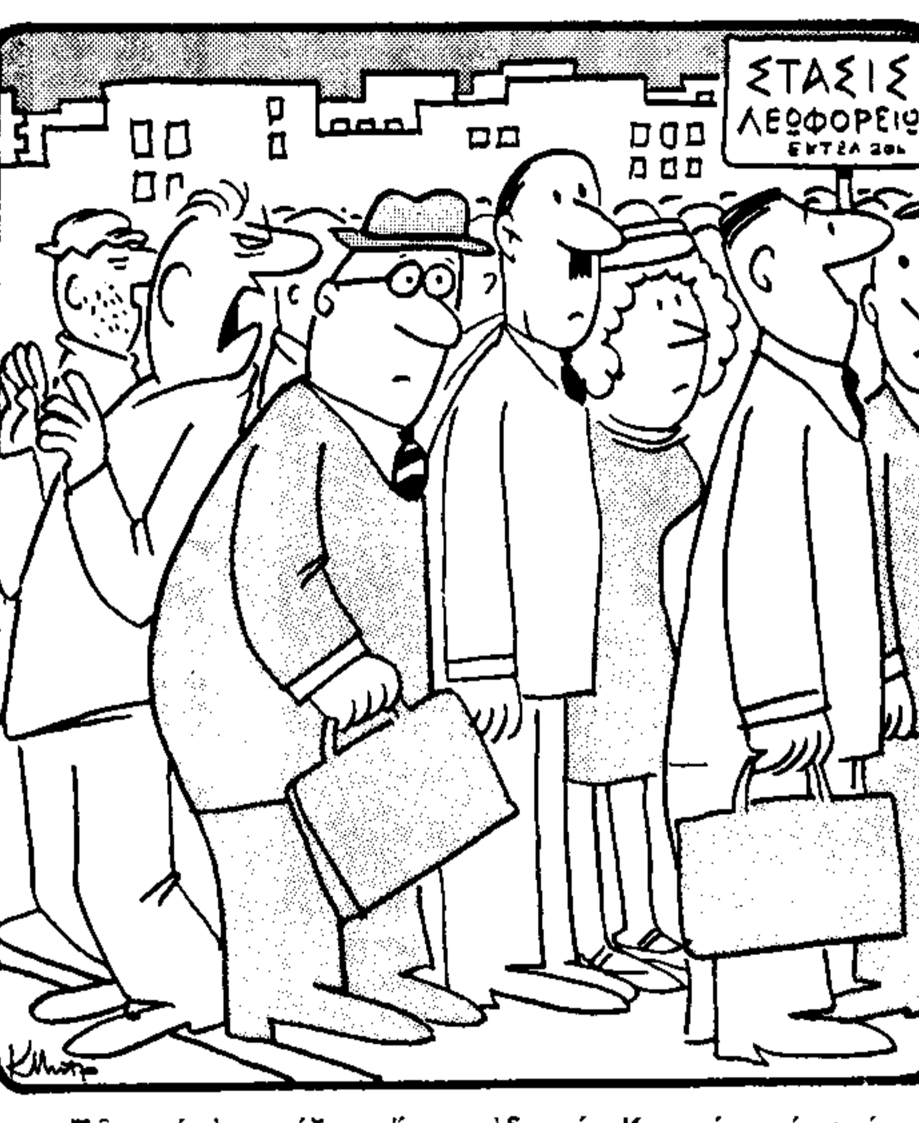
Πώς με έκπληξες έτσι, αδερφέ. Κοντεύω να φτάσω στο Κερσαχώρι Εύρωτας!...